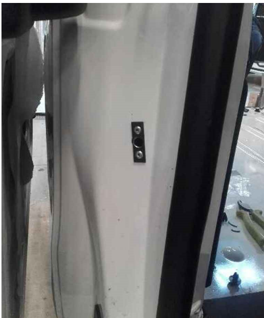
Vue de l'extérieur

Percer \varnothing 14 mm (agrandir) sur la marque de peinture obtenue, le trou central du puits et le fixer au montant à l'aide de 2 rivets après avoir percé les 2 petits trous de fixations.