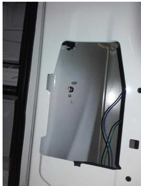
Vue de l'intérieur (ici puits scié)