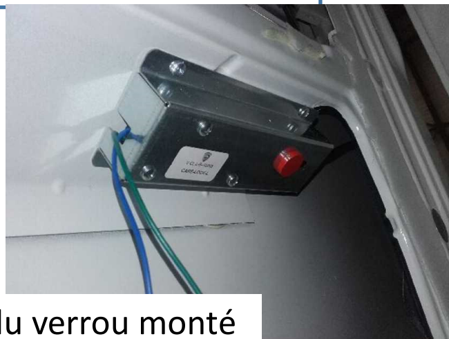
Vues finales du verrou monté

Pour cela il faut en premier monter le guide pêne au bout du guide flexible (Vue de l'intérieur de la porte)